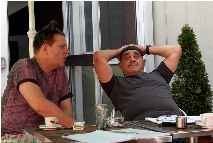
Scapin furfangjai - próba fotó: Mészáros Zsolt

- A filmesek sem találtak igazán rád. Igaz, egy-kettő fontosabb szerepben már láthattunk, például pár éve Herendi Gábor Lorájában.