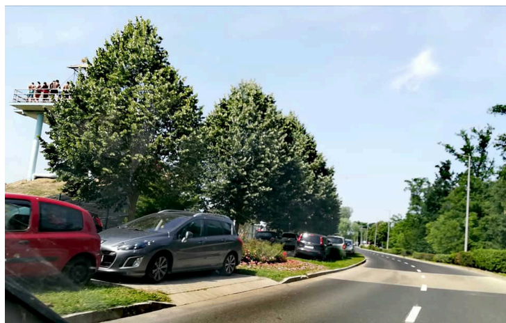
Sorban állás az utcán és a csúszdánál is. fotó: Sárvár régen és most

A pünkösdi hosszúhétvége miatt rengetegen jöttek Sárvárra egy-egy napra. A város úgy tűnik, még nem készült fel ekkora tömegre.