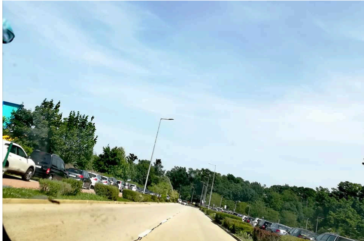
A bicikliút is megtelt parkoló autókkal.

Hihetetlen tömeg látogatott Sárvárra. A fürdő, a környező üzletek és szállodák parkolói megteltek, a Vadkert körúton a bicikliút és a járda is járhatatlan volt. A fürdő körül a virágágyások között is autók álltak, a tavaly megnyitott Rába parti parkoló is szépen megtelt.