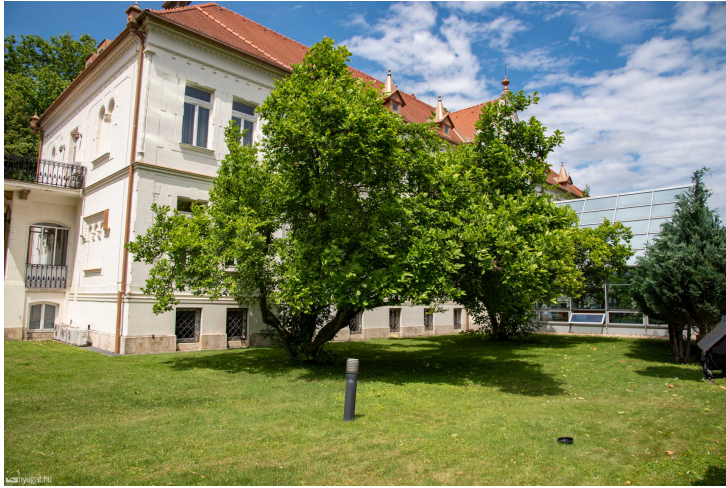
Örökzöld liliomfák a Pelikán kertjében