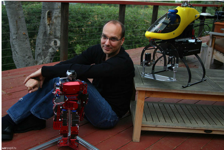
Andy Rubin, a robotfőnök

pénzsösszegek emlegetése nélkül is olyan komolyan hangzanak, hogy habókos hobbiprojektről szó sem lehet.