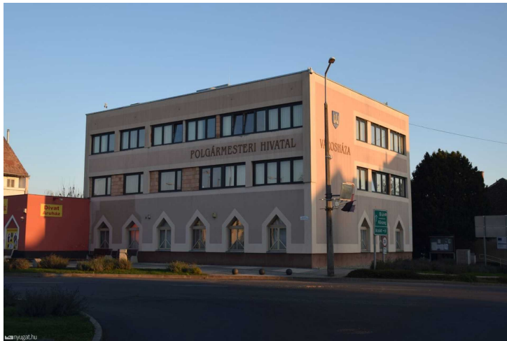
A csepregi városháza.

Tisztában vagyunk azzal, hogy a város költségvetése szoros és a vírushelyzet miatt még inkább nehéz helyzetbe kerültek. Ezt mi is tudjuk és nem várunk lehetetlent, de ennél a megalázó összegnél egy jó szó, egy kis törődés, egy érdeklődés az Önök részéről méltóbb lett volna.