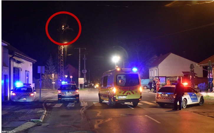
Éjszaka a baleset helyszínén

Nagy csattanás után tűz ütött ki egy villanyoszlopon a szombathelyi Szent Imre herceg és Paragvári utcák sarkán. Hamar kiderült, hogy egy ember ruhája égett a magasban. A 30 éves, közelben lakó férfi azonnal meghalt az áramütéstől.