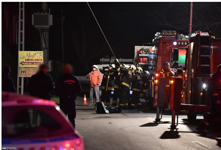
Még több kép a galériában

Azt már a közeli klub vendégeitől tudtuk meg, hogy az áldozat a közelben lakott. Elmondásuk szerint a 30 éves férfi korábban többször beszélt arról, hogy véget vet az életének, de csak pillanatnyi rosszkedvnek tudták be a baljós szavakat.