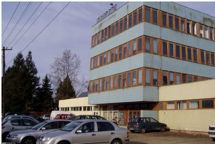
Felújított épületrészek között lepusztult irodaépület

A rendszerváltásig az Él gép jól, eredményesen működő vállalat volt, köszönhetően a biztos piacnak. A tulajdonviszonyok átalakulása az MRP résztulajdonosi privatizációs programmal valósult meg. Ez egy érdekes időszak volt, még a szombathelyi önkormányzat is kapott 10 százalék tulajdonrészt a földterületért, de volt részaránya a budapesti központi gyárnak és egy német cégnek.