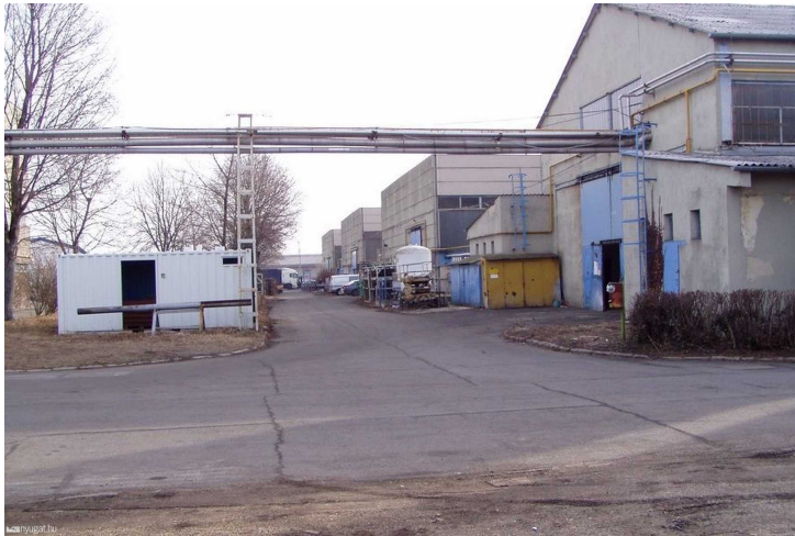
Kisebb vállalkozások települtek az üzemcsarnokokba

Az új ügyvezető intenzív piackutatással, profilbővítéssel próbálta még menteni a menthetőt, de az, hogy az MRP üzletrészt eladták egy befektetői csoportnak, még tovább rontott a helyzeten. Végül is 2006-ben a vállalkozás öncsődöt jelentett, és 2007-ben indult meg ellene a felszámolási eljárás.