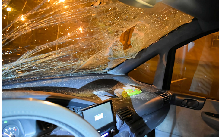
Elhagyta a helyszínt a szabálytalan gyalogost Ózd közelében elütő sofőr, de később feladta magát

Az autós segítségnyújtás nélkül elhajtott a helyszínről. A sofőr a baleset után, mintegy 20 perc múlva azonban önként jelentkezett a rendőrkapitányságon, és elismerte tettét.