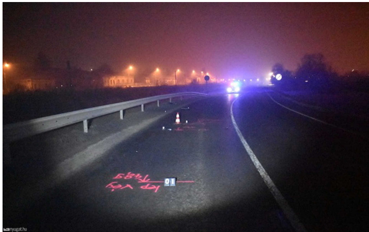
A sötét úton, rossz oldalon gyalogló, imbolyogva közlekedő gyalogos ellen is eljárás indult

Az autós segítségnyújtás nélkül elhajtott a helyszínről. A sofőr a baleset után, mintegy 20 perc múlva azonban önként jelentkezett a rendőrkapitányságon, és elismerte tettét.