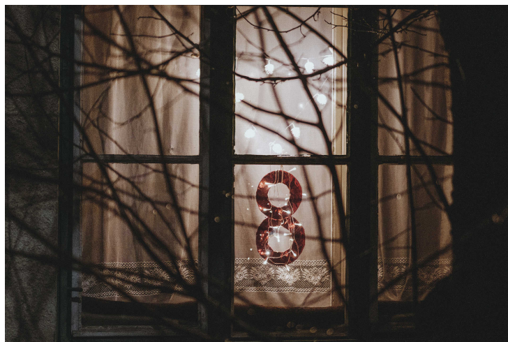
Még fény-árnyék játékot is láthatunk.

A covid miatt idén sajnos náluk is elmarad a közös gyertyagyújtás, az éneklés, a séta és a forraltborozás, de akadtak páran, akik a járvány ellenére is útra keltek megcsodálni a kivilágított ablakokat.