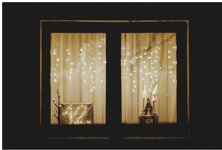
Gyönyörű karácsonyi hangulat.

Az élő kalendárium-ablakok december 1-jétől szentestéig világítanak. Minden nap egy új ablak gyűl ki, rajta jól látható számmal, ami az adott napot jelenti. A számok kiosztása évről évre változik, így az új lakók is részt vehetnek a közös karácsonyi kalendáriumozásban.