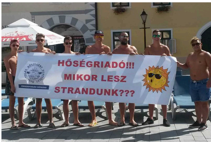
Mikor lesz strandunk? - kérdezik a kőszegiek

A település hirdetőoszlopain az áll, hogy a turisták és a lakosok is, strandolni a közeli Bükfürdőn vagy Lutzmannsburgban tudnak. Azonban egyféle tiltakozásként a kőszegiek nagy része inkább Lékára megy át csobbanni.