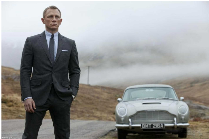
Legendák egymás mellett, skót tájban