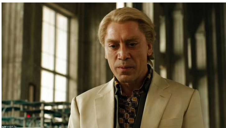
Fodrász Oscar-díjat, de azonnal! (Javier Bardem)

Mindig külön várakozás övezi a 007-es sztorik ősellenségének karakterét, motivációit és leginkább az őket életre keltő színészek kiválasztását. Nos, a forgatókönyvírók, producerek és a szereposztók ezen a vonalon is behúztak a tutiba. Javier Bardem személyében nem csak napjaink egyik legkarakteresebb európai színészét nyerték meg a sértett és bosszúálló, M elismeréséért és szeretetéért bármire kész Raul Silva eljátszására, hanem a filmmítosz szintjén pontosan reagálnak a világban a hidegháború befejeződése óta végbement változásokra.