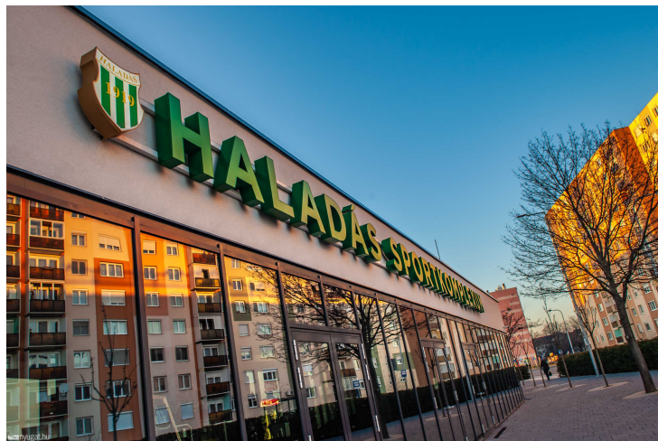
Jól látszik, hogy a felső emeletek fényben úsznak

Mint mondta, a legnagyobb problémát a stadion ponyvateeteje okozza. Az ugyanis a közelben lévő tízemeletesek ablakaira veri vissza a fényt, és így a lakásokban nappal is le kell eresztetni a rolókat. Erről egyébként már két éve írtunk .