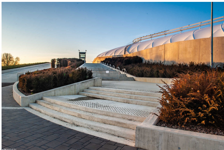
Itt látszik, hogyan fénylik a ponyva fotó: Nagy Jácint

Kopcsándi azzal indokolta kérését, hogy egyre több környéken élő jelzi, hogy lakásának, ingatlanjának csökkent a forgalmi értéke és romlottak az életkörülményei. És ezt többen aláírásukkal is megerősítették.