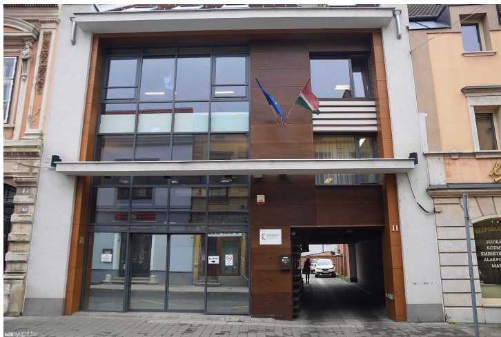
Szombathely, Kossuth utca 11. - A tervek szerint ide kell majd menni a korona-vírus gyanúval.