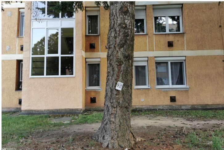
Szeptember elején még lehetett találkozni ezekkel a plakátokkal, most már nem

Sajnos azonban a katedra kartonból volt, így csak ideig-óráig állt. Szeptemberben még fedezet nélkül lehetett Covid-911 plakátokat ragasztgatni a fákra és villanyoszlopokra, hanyagul vállakat rángatni, ha nem volt a zsebben maszk és az igazság bajnokát játszva posztolgatni Facebookra arról, hogy az egész koronavírus csak egy összeesküvés.