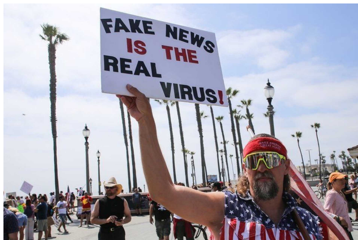
Az álhír a valódi vírus – áll a táblán.

Mikor megkérdeztük tőle, hogy ugyan miért nem viseli a védőfelszerelést, vállvonogatva annyit mondott, hogy azért, mert nincs semmiféle vírus. Állítását ezek után azzal támasztotta alá, hogy még egy koronavírusossal sem találkozott, pedig ő sok mindenkivel találkozik.