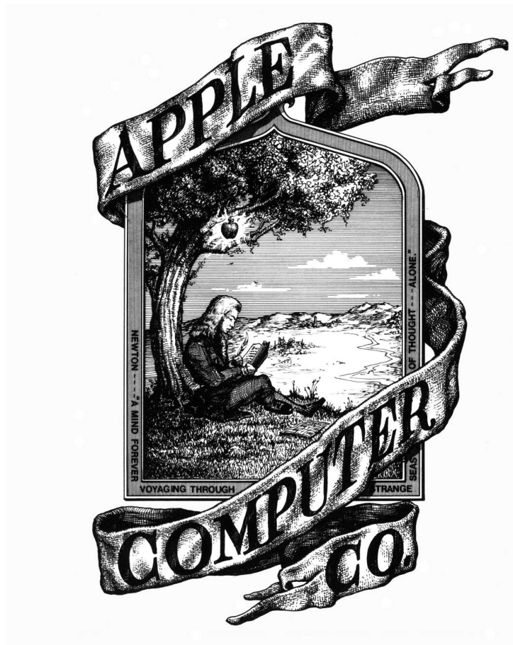
Az első logó