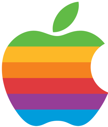
A szivárványos Apple logó

Később a logó elvesztette színeit, előbb fekete, majd szürke lett.