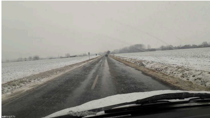
A Sótóny-Ikervár út szerdán délután

alacsonyabb rendű utat Sótóny és Ikervár között, és ha nem is volt tökéletes, azért nagy gond sem volt vele.