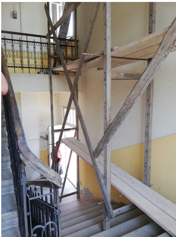
Ilyen most.

A támogatásokat és a sok segítséget nagyon-nagyon köszönjük! De hogy áll a felújítás? A munka javában folyik: villanyszerelés, vakolás, glettelés. Ebben a fázisban is több önkéntes munkálkodik. Hamarosan sor kerül a festésre is. Reméljük, hogy a tanévkezdésre egy megújult, megszépült zeneiskolában tudjuk fogadni a diákjainkat – zárta mondandóját az igazgató.