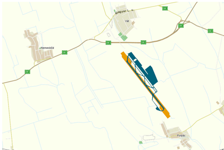
A tervezett repülőtér elhelyezkedése térképen