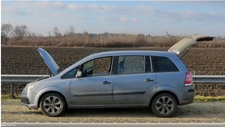
Az autóban összesen 10 ember utazott

A vádlott elindult az illegális bevándorlókkal az időközben ugyancsak telefonon közölt útvonalat követve a magyar-osztrák határ felé.