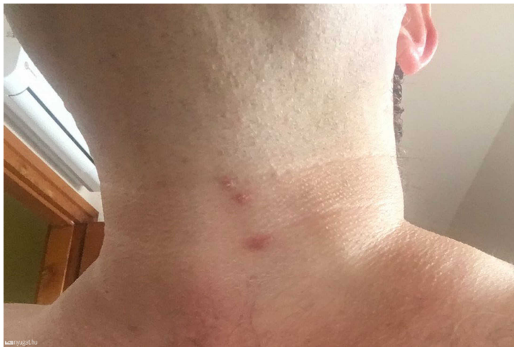
Áldozatok százain

Elsősorban Körmentről, de Szombathelyről és Vas megye más tájairól is egyre több ilyen bejelentés érkezett a szokásosnál sokkal nagyobb számban. Aztán csak nőtt a lista, átlagosan 6-8 bejelentéssel hetente.