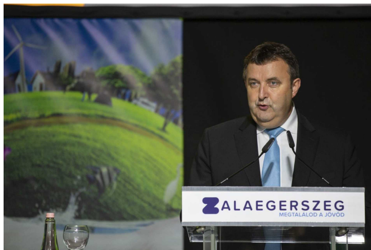
Palkovics László

Palkovics László a GreenTech - Zöld energia és fenntarthatóság című szakkiállításon és konferencián a gazdaságfejlesztés és a környezetvédelem összefüggéseiről tartott előadásában azt mondta, hogy nemcsak hitellel, hanem vissza nem térítendő támogatással is szeretnék ösztönözni a megújuló energiaforrások használatát.