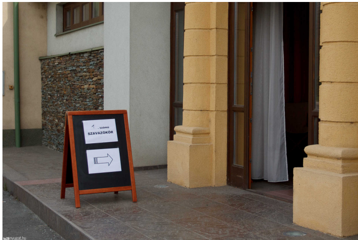
Szavazókör bejárata Szombathelyen 2014 tavaszán

A világ demokratikus részén ritka, hogy ugyanazon az évben tartják az országgyűlési és a helyhatósági választásokat. Sőt a szövetségi rendszerű országokban, mint például Németország, az egyes tartományok is eltérő időpontban választanak önkormányzatokat.