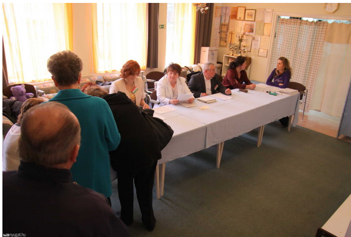
Országgyűlési választás tavaly Szombathelyen

A ciklus öt évre nőtt, most ugyanabban az évben van az önkormányzati és az EP-választás, viszont utóbbi tavasszal, előbbi ősszel. Így mégiscsak két választás van öt évente, nincs megtakarítás, és kétszer kell a választópolgárokat is mozgósítani, ez a megfogalmazás egyébként a választási kampány udvarias neve.