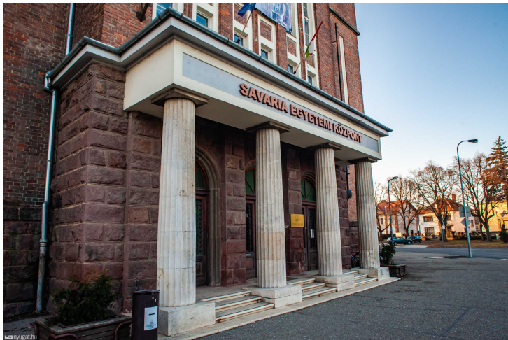
A SEK-en 2025-ig biztosan marad a gépészképzés.