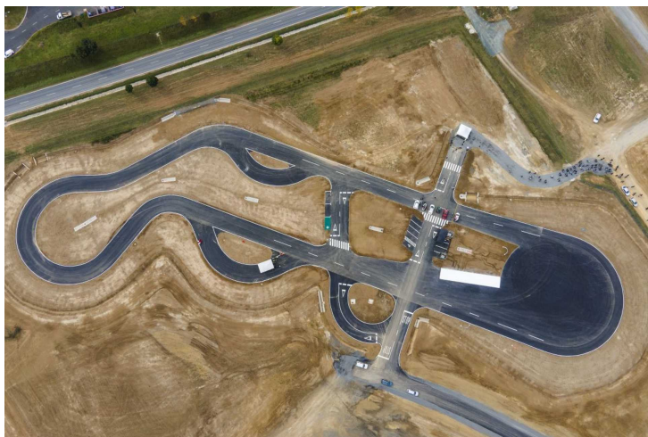
Tesztpálya Zalaegerszegen.

Tavaly szeptemberben adták át Zalaegerszegen a négycsillagos Hotel Balaton üzleti szállodát, ami a város kutatás-fejlesztési központtá válására alapoz. Eközben Szombathelyen bezárt a Claudius hotel , és bedőlni látszik a SZOVA szállodaépítési projektje is.