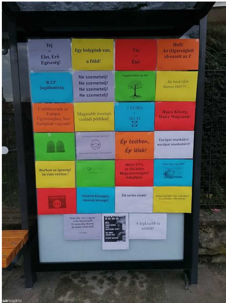
Kőszegi buszálló