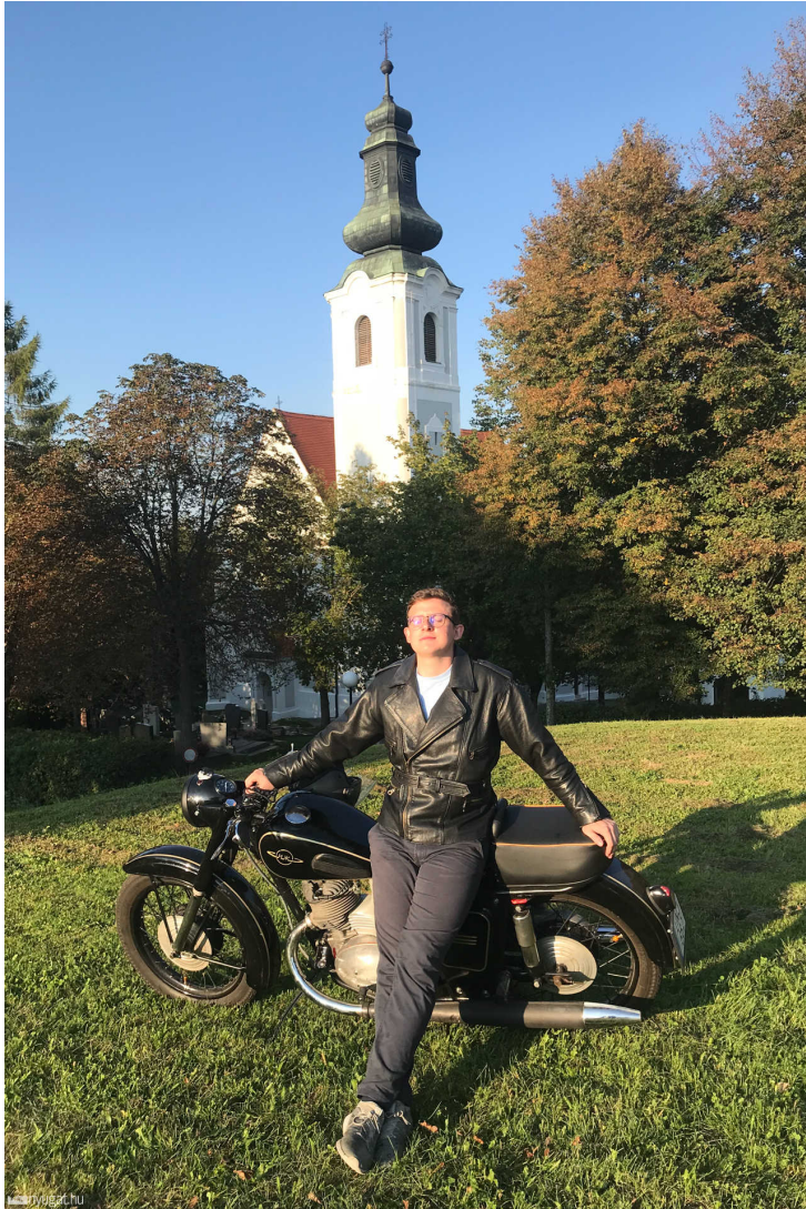
Horváth Márk