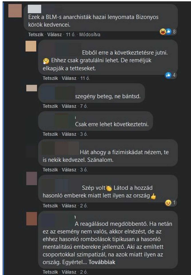
Hozzászólások a poszt alatt

Ötből egy hozzászóló pedig megpróbálta a lehetetlent, vagyis csitítani a zúgolódást azzal, hogy leírta: