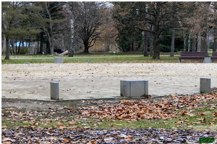
Eltűnt padok a Csónakázó-tó szigetén

Egy szombathelyi Facebook-csoport egyik tagja vasárnap este „ elszomorítónak és felháborítónak ” nevezte posztjában, hogy a Csónakázó-tó szigetén a padok eltűntek, helyükön pedig csak a csupasz betonlábak meredeznek ki a földből.