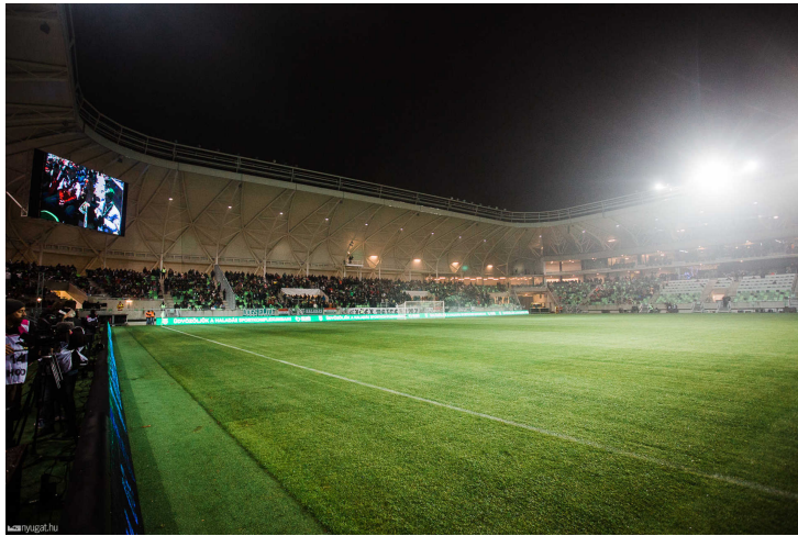
Látnak fantáziát a szombathelyi stadionban

Balassa telefonon megerősítette az információt, mit mondta, részt vett a tárgyalások előkészítésében.