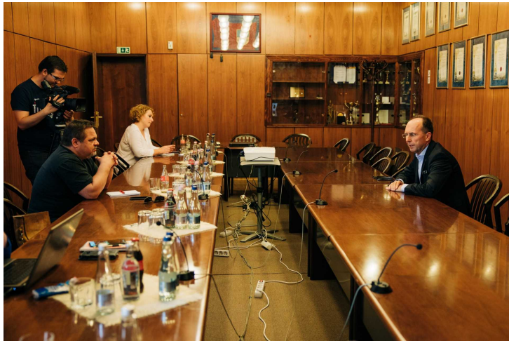
Közgyűlés utáni sajtótájékoztató

Ebben benne van valószínűleg az is, hogy négy hónap után tartottak közgyűlést, és a veszélyhelyzet, a rendkívüli jogrend hónapjai után ez volt az első kézzelfogható bizonyíték arra, hogy szépen térünk vissza a normális kerékvágásba.