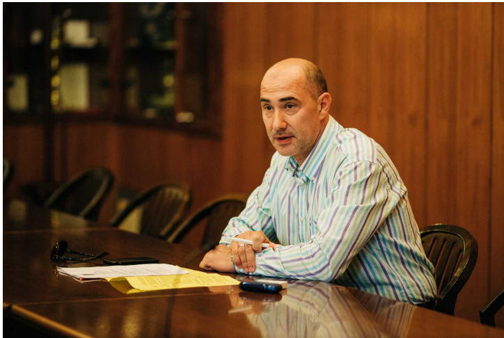
Illés Károly

Kiemelte, hogy a gazdasági társaságok közül a Médiaközpontnak nem fogadták el sem a beszámolóját, sem az üzleti tervét. A cég önkormányzati támogatását a tavalyi 85 millióról 175 millióra emelték fel, és közben indokolatlanul magas létszámmal, külsős szerződésekkel, túl sok vezetői beosztású munkatárssal dolgoznak.