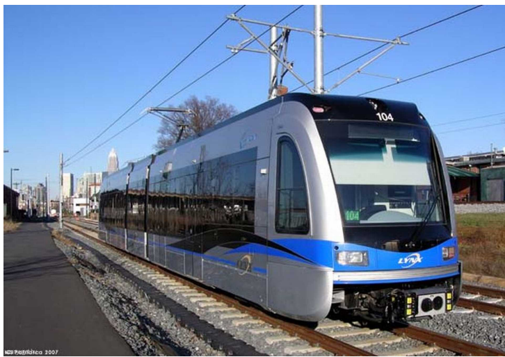
Akár ilyen villamosokkal is utazhatunk majd