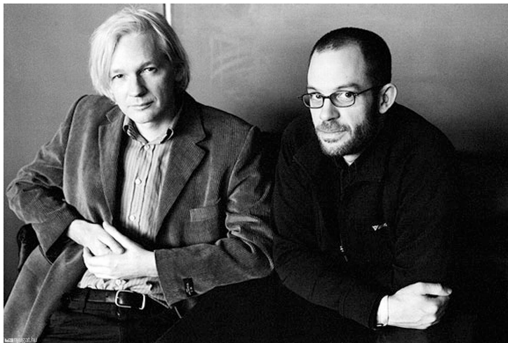
Julian és Daniel, ausztrál és német, két egykori kollega

Daniel Domscheit-Berg 300 oldala azonban sokkal jobban árnyalja a hős képét. Daniel volt az, aki még idejekorán kapaszkodott fel a Wikileaks-hajóra, akkor, amikor a népszerűség még a látóhatár közelében sem volt. Assange örült a társnak, és együtt fogtak össze a nagy, közös cél érdekében. Amikor viszont a médiafigyelem hirtelen úgy kezdett összpontosulni rájuk, mint nagyító alatti papírfecniire az egyetlen pontba szűkült napsugár, elkezdett felperzselődni kettejük viszonya, egészen 2010-es különválásukig.