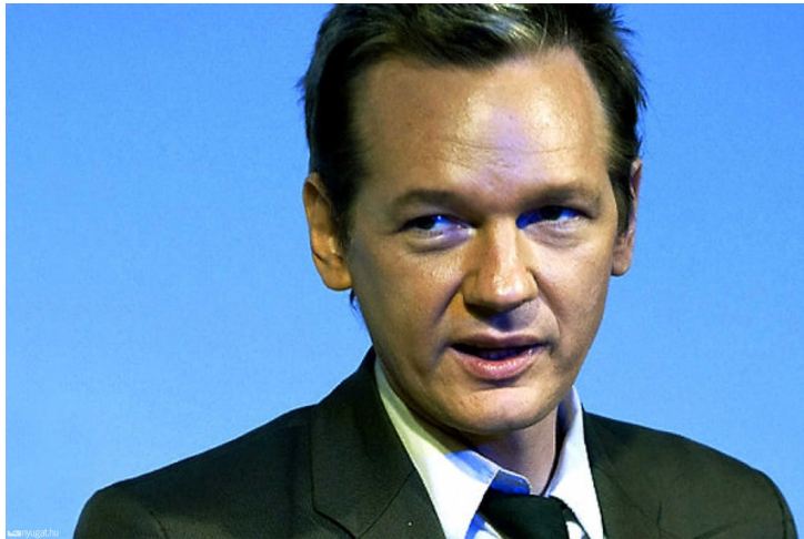
Julian Assange egy előadáson

A könyv erre a vonalra fúzi fel az elbeszélést, kronológiai rendben, hogy még látványosabb legyen a Wikileaks-vezért pálfordulása, vagy inkább kifordulása magából. Helyenként lehetne gördülékenyebb, de még így is kellően olvasmányos - végül is ki ne olvasna arról, hogy "a világ legveszélyesebb weboldalának" első emberének milyen érdekes a viszonya a nőkhöz, miért húzott öltönyt egy komoly szöveg megírásához, miközben általában slamposan nézett ki, és hogy képes volt a folytonos fenyegettség auráját kialakítani maga körül , ami egy ponton már odáig fajult, hogy golyóálló mellényt javasolt, és hogy a föld alá kéne vonulniuk.