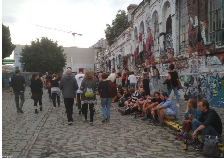
Eels-koncert Bécsben

gyárudvar, amelyet időközben a maga képére formált az alternatív kultúra és rajongótábora. De mindent jól látni és hallani, és a végtelen számú büféből kifolyólag egy-két percnél tovább nem kell várnunk a 4 eurós sörünkre.