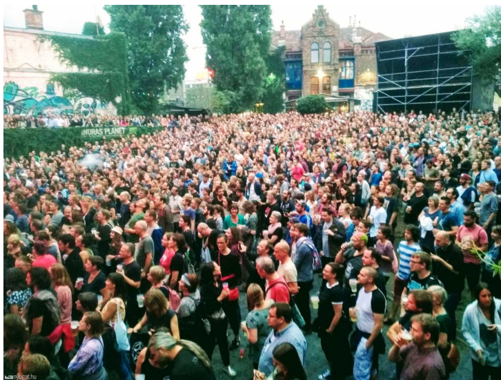
Eels-rajongók a bécsi koncertre várva fotó: Józing Antal (telefonos fotó)

Valójában esetükben mindegy, hogy mikor volt ez az elcsípés, most, 10 éve vagy 20 éve, soha nem voltak igazán sztárok, cserében a rajongók soha nem hanyagolták el őket.